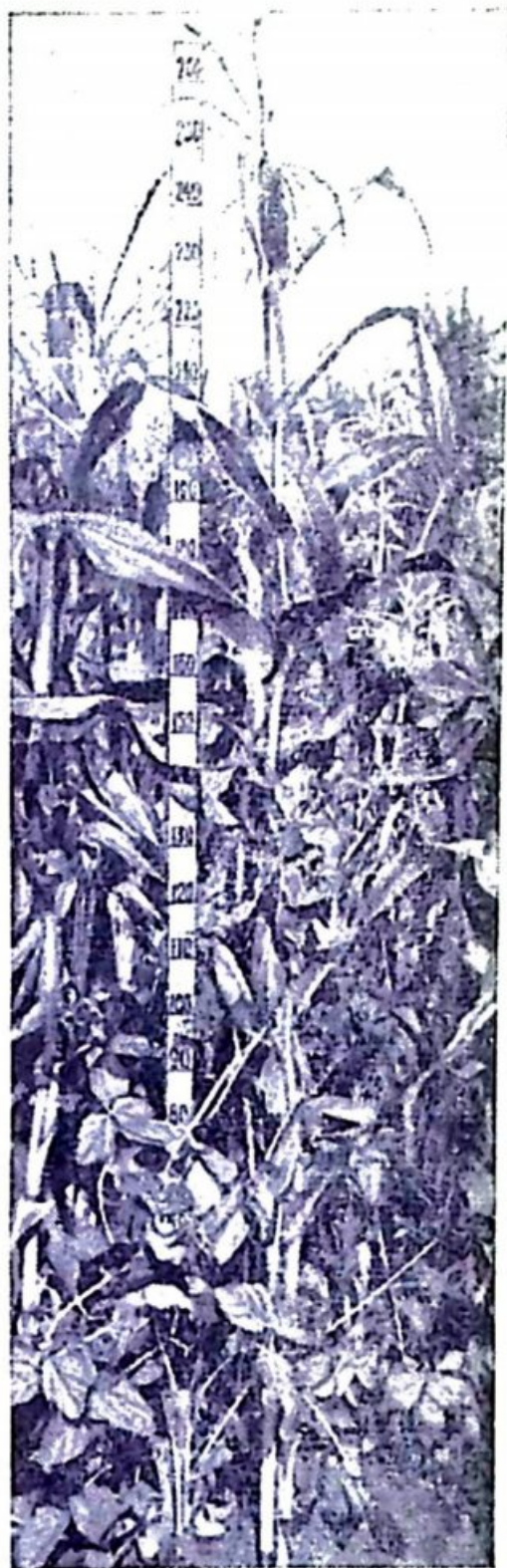
Рис. 2. Размещение в гнезде растений кукурузы и сои.

В опытах нами изучались следующие способы посева кукурузно-бобовых смесей: