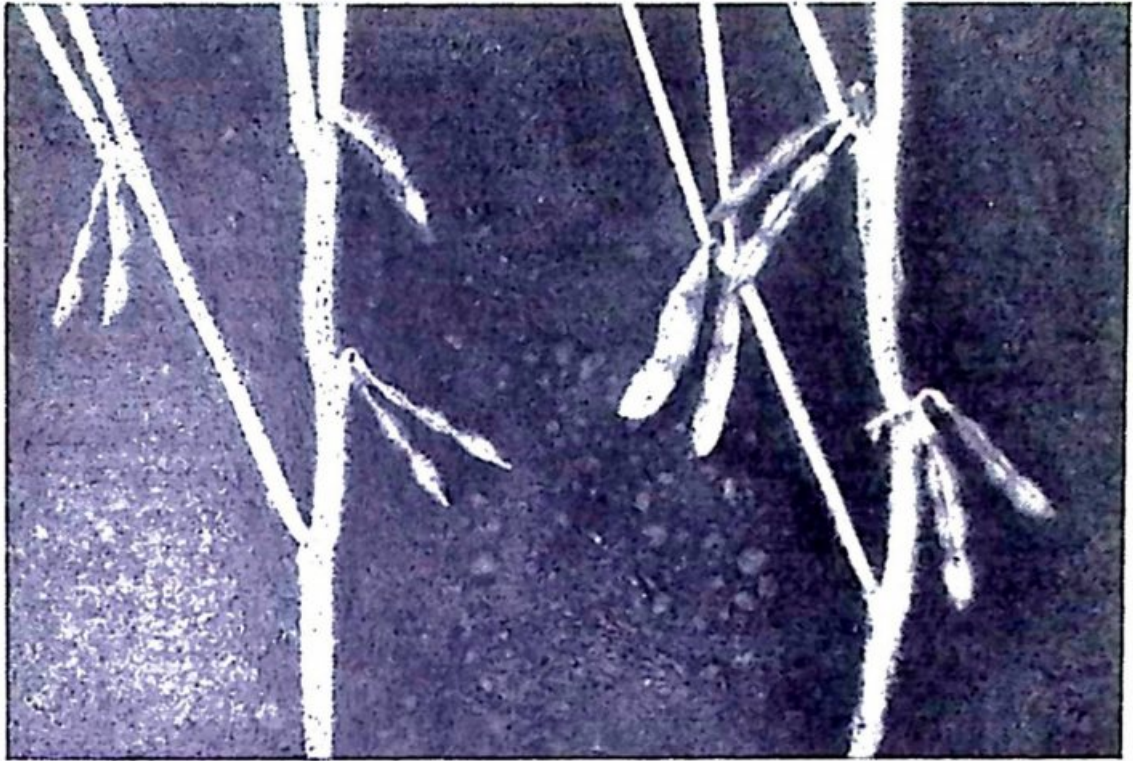
Рис. 2. Влияние молибдена на развитие бобов: справа — молибден внесен.

Кроме этого, под влиянием молибдена на 15—30 г увеличивается вес 1000 зерен, бобы становятся заметно крупнее (рис. 2). Содержание белка возрастает на 3—5%. Содержание жира в зерне иногда несколько снижается, однако общий выход жира с 1 га из-за повышения урожая значительно увеличивается.