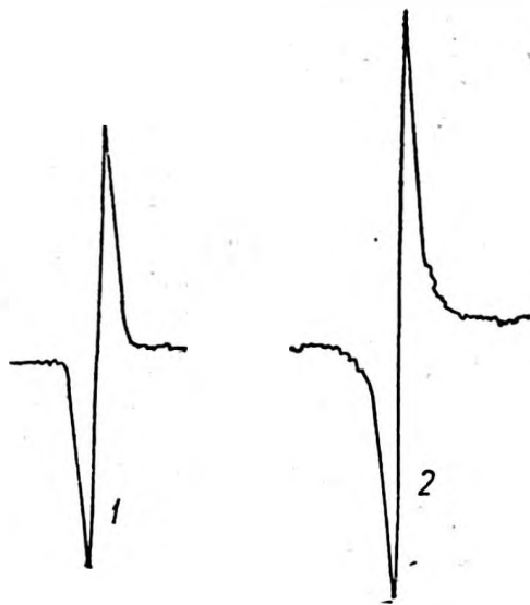
Слева — спектры ЯРМ: 1 — соевого масла (50 мг), 2 — индивидуального зерна сои; справа — зависимость масличности семян от их веса

семян 283 отмечены отдельные семена с довольно высокой масличностью (26,5, 25,5 и 25,3%).