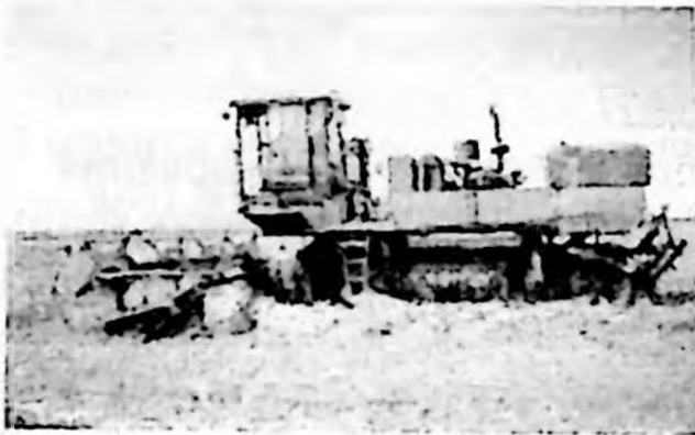
Рис. 1. Универсальное энергетическое средство на резиноармированных гусеницах: а) УЭС-РГ образца 2000 года; б) модернизированный образец УЭС-РГ – самоходное шасси модели УЭС-150РГ