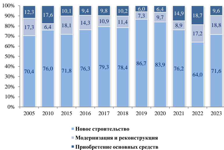
Структура инвестиций по направлениям (без субъектов малого предпринимательства и объема инвестиций, не наблюдаемых прямыми статистическими методами)

По данным выборочного обследования инвестиционной активности организаций, осуществляющих деятельность в сфере добычи полезных ископаемых, обрабатывающей промышленности, обеспечения электрической энергией, газом и паром; кондиционирования воздуха, водоснабжения; водоотведения, организации сбора и утилизации отходов, деятельности по ликвидации загрязнений в 2023 году, одной из популярных целей инвестирования у организаций, как и в предыдущие годы, оставалась замена изношенной техники и оборудования, на что указали 73% респондентов, 59% -