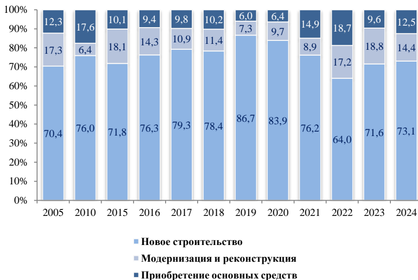
Структура инвестиций по направлениям (без субъектов малого предпринимательства и объема инвестиций, не наблюдаемых прямыми статистическими методами)

По данным выборочного обследования инвестиционной активности организаций, осуществляющих деятельность в сфере добычи полезных